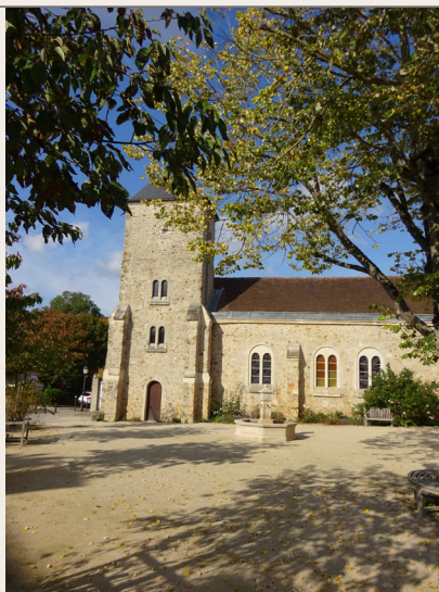
Eglise des Loges-en-Josas

Au XIII e siècle, une chapelle dédiée à saint Eustache fut édifée. Détruite au XVII e siècle, elle fut remplacée par l'église actuelle, construite vers le milieu du XVIII e siècle. Saint Eustache est un martyr de l'époque de Trajan et Hadrien. Considéré comme le patron des chasseurs, la communauté forestière du lieu-dit Les Loges se place sous sa protection. Cet édifice est composé d'une nef unique flanquée d'un clocher carré et la façade conserve une porte Renaissance du XVI e siècle. De nouveaux vitraux furent installés en 1984-1985 par les peintres-verriers Annie et Patrick Confetti.