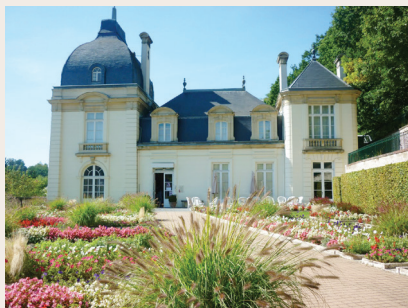
Musée de la Toile de Jouy

dans le costume et l'ameublement depuis le XVIII e siècle.