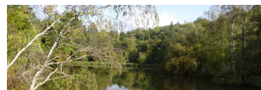
Etang des côtes de Montbron

6 Virer à gauche sur la sente qui longe la route. Au carrefour suivant, tourner à gauche rue de la Ferme-de-l'Hôpital, en suivant le parc Yvon-Le-Coz. Prendre la deuxième rue à droite (rue Guy-Mocquet). Juste avant l'église, emprunter la Grande Rue à droite. Tourner à gauche sente de la Fontaine. Elle descend dans le bois. Au T, aller à gauche et continuer tout droit jusqu'à la Maison forestière de la Porte de Jouy. À la route, bifurquer à droite, traverser la Bièvre et passer sous le pont de la voie ferrée à hauteur de la gare de Petit-Jouy - Les Loges.