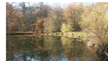
Porte de Jouy et étang des côtes de Montbron