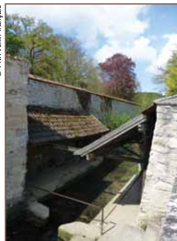
Lavoir sur la Moncient.