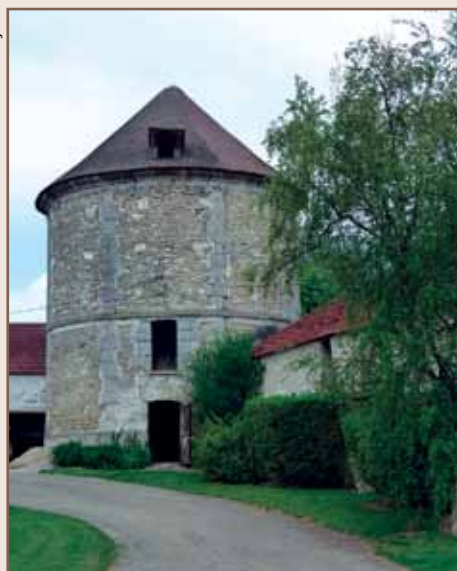
Ferme du Colombier.