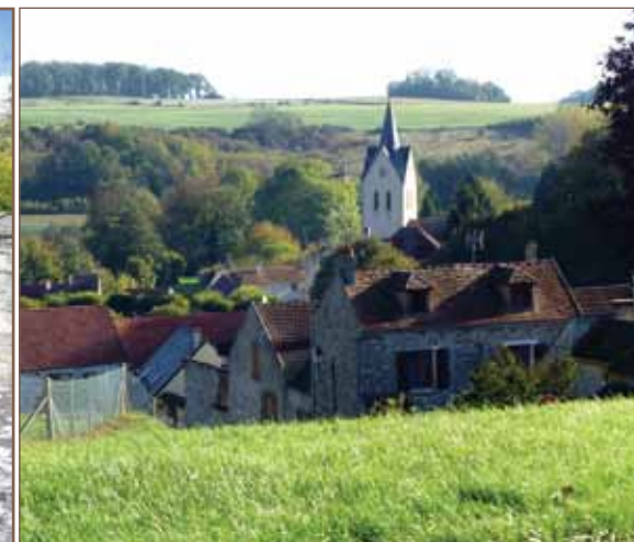
Vue sur le village de Sailly.