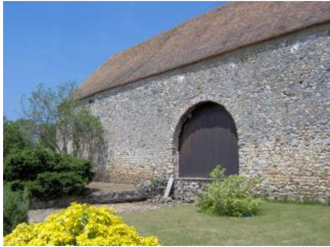
Ferme à Flexanville

(1) De l'église, suivre la D 45 en direction d'Orgerus (sud-ouest). À la sortie de Flexanville, s'engager sur le chemin à droite. Tout droit, traverser le bois et, à l'orée, se diriger à gauche sur 300 m. Avant le ru, prendre le chemin à droite et gagner la ferme de la Poussinière.