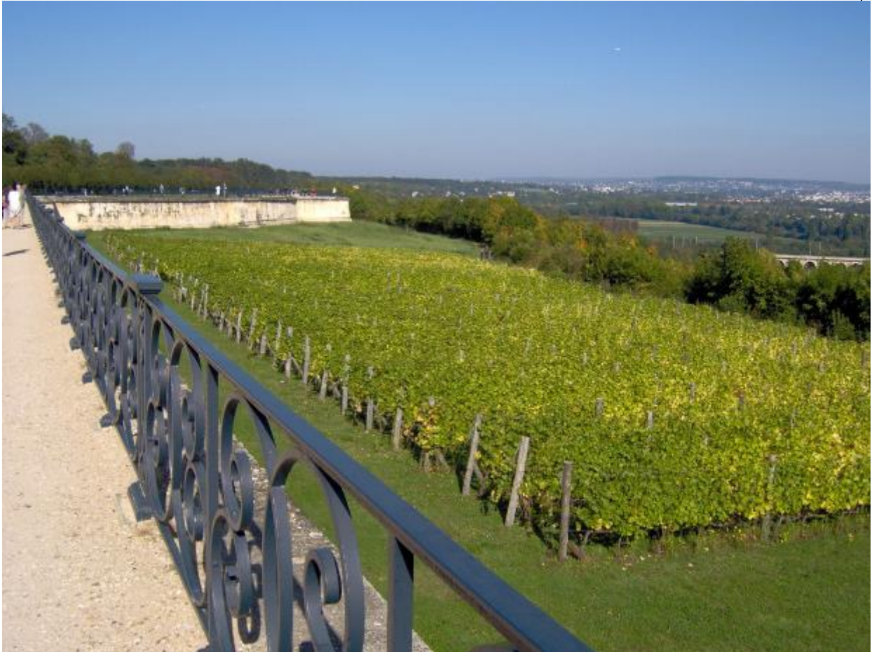
Terrasse de Saint-Germain-en-Laye