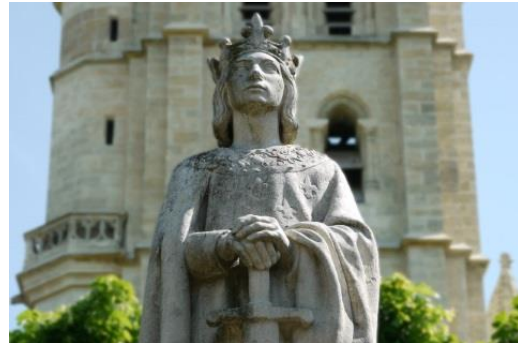
Poissy : statue de St Louis

(1) Sortir de la gare de Maisons-Laffitte, place de la Libération (côté des voies, opposé à la mairie) et s'engager à droite rue St Nicolas.